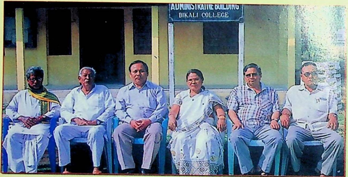
মহাবিদ্যালয় পৰিচালনা সমিতিৰ সদস্য/সদস্যসকল