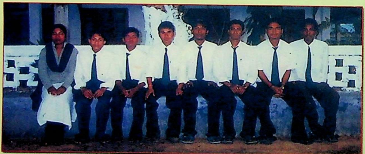
ছাত্ৰ একতা সভা, ২০০৬-০৭ ইং শিক্ষাবৰ্ষ