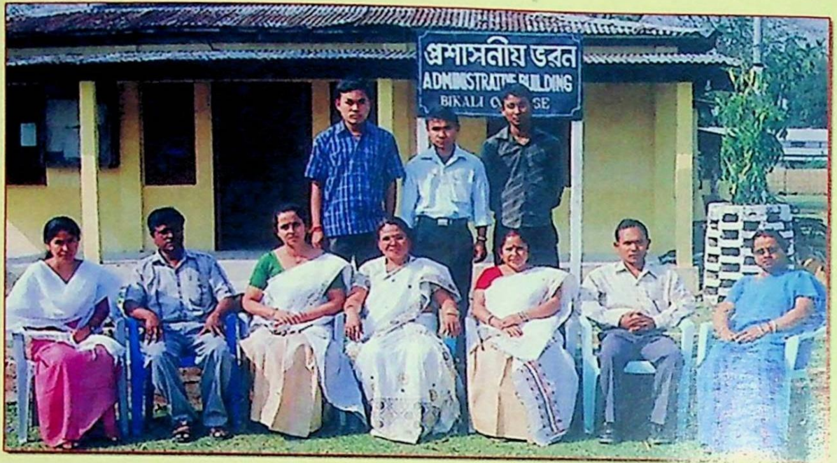
সম্পাদনা সমিতি, বিকালিয়ান