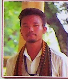
धन खुंगुर दैमारी सुजुगिरि