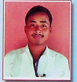
हिरकज्यति खाखलारी सुजुगिरि