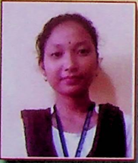
बिथराइ स्वरगियारि सुजुगिरि