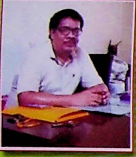
ड० मनज गगै मासिगिरि